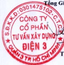
Thái Tuấn Tài